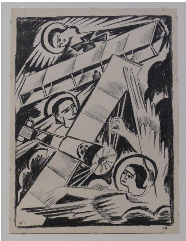
Planche X : Anges et avions