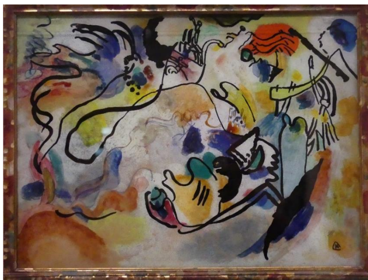
Jüngster Tag (Le Jour du Jugement dernier) 1912

Ce chef d'œuvre de Kandinsky (en bas à droite) est l'aboutissement de plusieurs années de travail sur le thème de l'Apocalypse et plus précisément du Jugement dernier. Entre 1910 et 1913, une intense réflexion occupe en effet l'artiste qui souhaite faire advenir une plus grande spiritualité dans l'art. Ce « grand combat » fait de lui un artiste-prophète et le mène à dissoudre les motifs figuratifs du Jugement dernier dans un langage pictural de plus en plus abstrait. La trompette annonciatrice, peinte en jaune, est l'un des derniers éléments discernables.