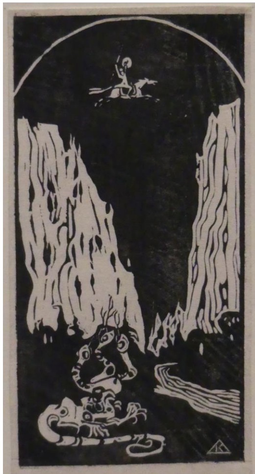
Dreiköpfiger Drache (Dragon à 3 têtes) 1903

Œuvres de Vassili Kandinsky (1866-1944) présentées à cette même exposition, prêtées par le centre Pompidou MNAM /CCI