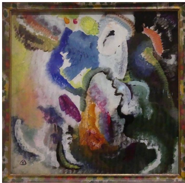
Mit Reiter (Avec cavalier) 1912