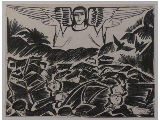
Planche XIII : fosse commune (fosse fraternelle)

Ces planches sont montrées dans le cadre de l'exposition Apocalypse qui a lieu à la Bibliothèque nationale de France à Paris jusqu'au 8 juin 2025. Y sont exposés des manuscrits, des tableaux, des tapisseries allant du Moyen Age jusqu'à nos jours, sur le thème du livre éponyme de Saint Jean. Ce livre fait partie des Saintes Ecritures, plus précisément c'est le dernier livre du Nouveau Testament. Il se présente comme une révélation du combat entre le Bien et le Mal à la fin des temps. Dans le langage courant, le mot apocalypse évoque une catastrophe, un cataclysme monstrueux, et il est vrai que le livre l'Apocalypse décrit des fléaux notamment la conquête, la guerre, la famine et la mort (cf ci-dessous le tableau de Viktor Vasnetsov Les 4 cavaliers de l'Apocalypse, présenté dans la gazette de Kalinka de novembre 2022), mais il se termine par la victoire du Bien et l'avènement de la Jérusalem céleste. Il est donc porteur d'un message d'espérance à long terme. Pourtant les artistes ont le plus souvent choisi les passages relatifs aux tribulations des hommes sous l'emprise du Mal.