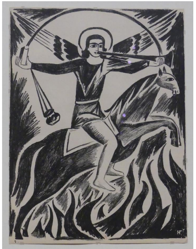
Planche VII : L'archange Saint Michel