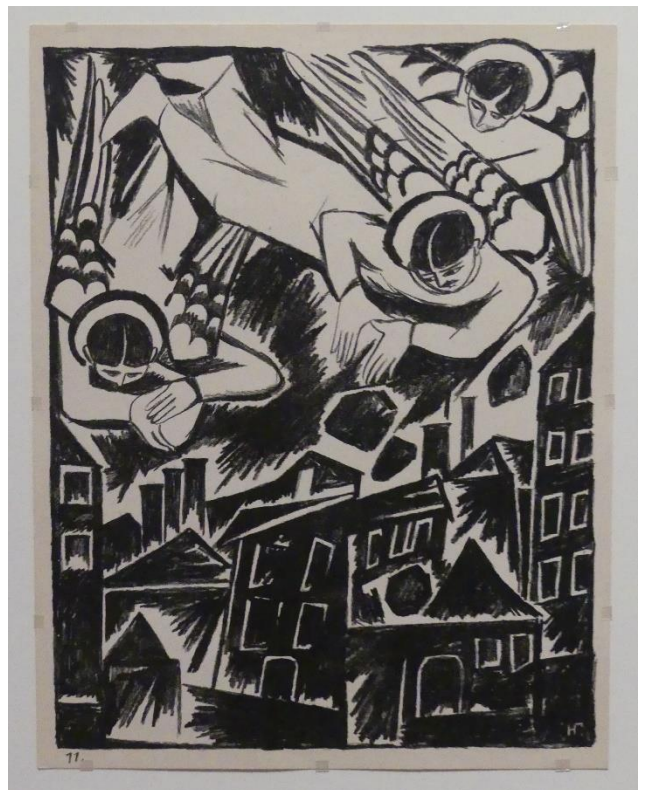
Planche XI : cité maudite